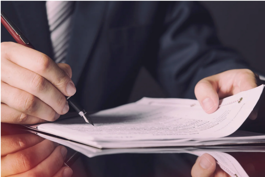
תביעות נכי צה"ל